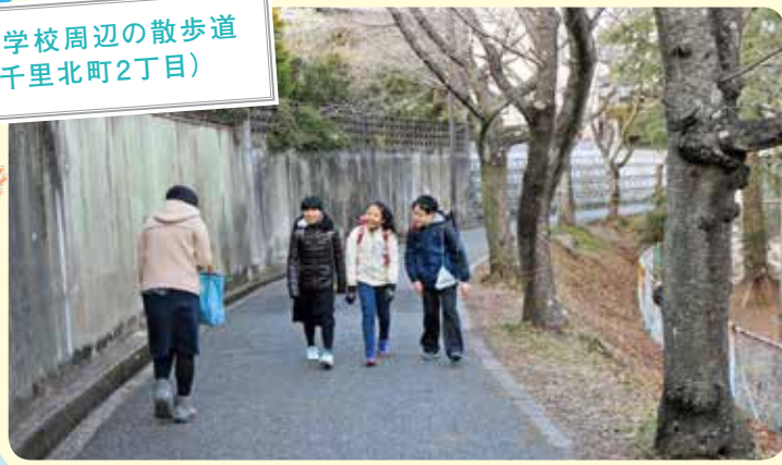
北丘小学校周辺の散歩道 (新千里北町2丁目)