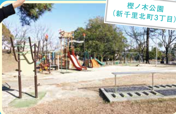
榎ノ木公園 (新千里北町3丁目)

新千里北町の歩行者専用道路にはユニークな形の車止めが設置されています。ゾウやリスなど動物形のほか、先に坂や階段があることを示す幾何学形のものがあります。