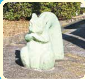
歩行者専用道路の車止め (新千里北町2丁目など)

千里北町公園から北丘小学校沿いに続く道は、散策などで地域に親しまれています。道路沿いには約100本のサクラの木が植えられ、春になると桃色に美しく彩られます。